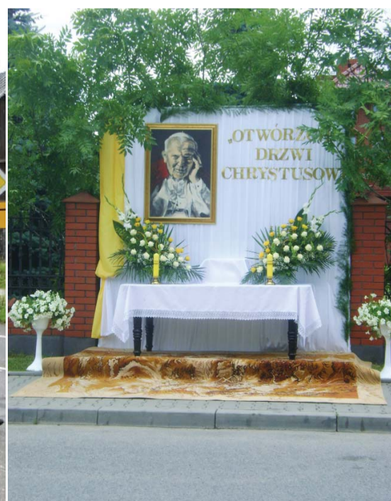
Ołtarz przy posesji Państwa Wadowskich