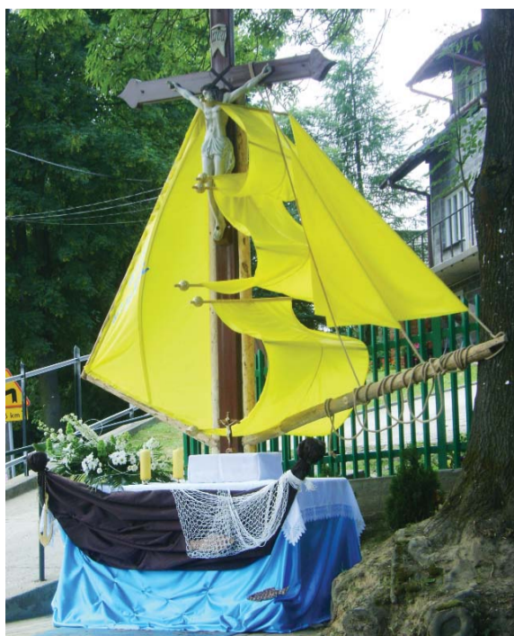
Ołtarz przy drodze na Krasieniec